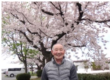
桜に負けない素敵な笑顔で♪

今年は、例年より早い開花となりましたが、連日の新型コロナウイルス関連のニュースで沈んでいた気持ちを明るく華やかにしてくれる桜でした。施設内の桜並木を目にされた利用者様から、「弘前の桜を見に行かなくても充分だね！」「すごく綺麗なね」という声が聞かれました。撮影の日は風が強く、肌寒く感じましたが、桜の下では皆さん桜に負けない笑顔を見せてくれました。