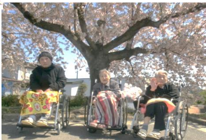
なんぼ綺麗な桜だ〜♪

四月二十一日、お花見の写真撮影を行いました。昨年同様、新型コロナウイルス感染症防止の為、お花見ドライブに行くことは出来ませんでしたが、敷地内に咲いた満開の桜の下で、撮影することが出来ました。今年の桜は、特に開花が早く風が強い日も続いています。撮影日は快晴に恵まれ、入所者様から「桜を見ると春を感じる」「見れて良かった！良かった！」など、様々な喜びの声と笑顔が溢れた一日となりました。