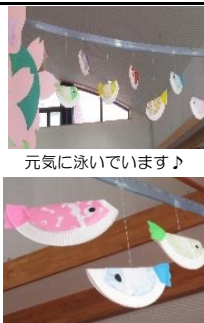
元気に泳いでいます♪

今回は、『鯉のぼり』です。鯉のぼりの形に切った折り紙のパーツを、紙皿の決められた所に、両面テープで貼り付けていきます。少し曲がったりもしますがそれが味となって個性豊かな作品が出来上がっていきます。最後は、シールの目を貼って完成です。カラフルな鯉のぼりは、ピニールテープで繋がり食堂ホールで元気に泳いでいます。完成した鯉のぼりを見て、入所者の方々は、「可愛く出来て良かった」「こういうの作るの好きなのよ」と笑顔で話してくれました。また、皆さんと楽しみなながら、作品を作っていくきたいと思います。