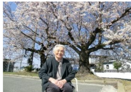
気持ち良い天気です